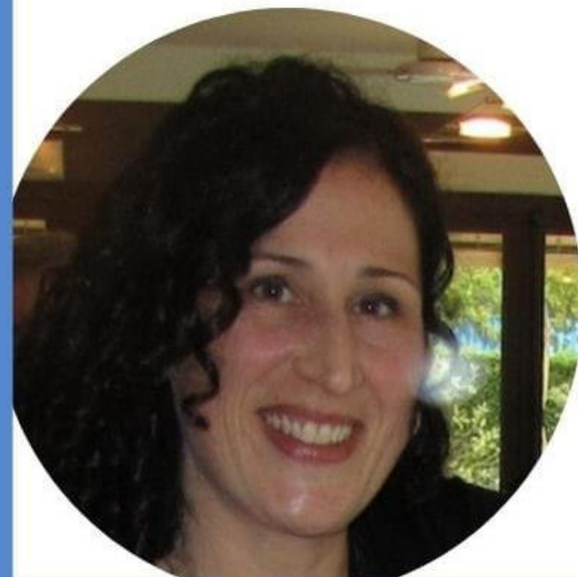
GIOVANNA TESTA SCUOLA PRIMARIA

Credo che il CSPI possa essere uno strumento per dare voce ai docenti e per costruire una scuola migliore per tutti. Se anche tu credi in questi valori vota per me, vota la lista "NOI SCUOLA BENE COMUNE"!